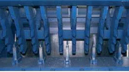
SR IV K IV 2000

Azami doldurma gücünde optimal bir son kaliteye ulaşabilmek için her hazırlamaya başlamadan önce değişik koşulların sağlanması gerekmektedir. Kendisini kanıtlamış Matthiessen torba bıçklarının daha da geliştirilmesi, 45 ton/h'a kadar doldurma gücü sağlamaktadır. Yayı amotisör sistemli segmanı ile yeni geliştirilmiş bıçkı çark dişi, mükemmel yırtma ve boşaltma oranında en üstün doldurma oranlarını sağlamaktadır.