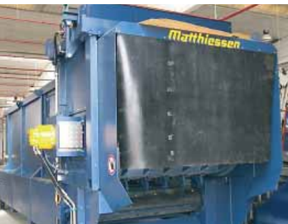
SR IV KIV 2000