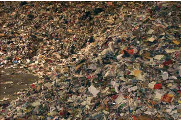
Kağıt ve kartonlar