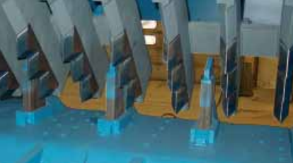
SR III K IV 1250