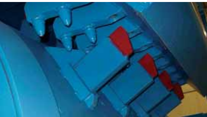
SR III K III 1250